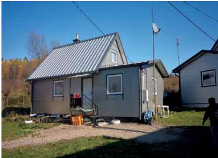
Zadział: jeden z kontenerów mieszkalnych umieszczonych na osiedlu w latach 2011-2012

Także i w tym przypadku Romowie zwracali jednak uwagę na konieczność przeprowadzenia remontów. W większości były to drobne usterki, które mieszkańcy mogliby reperować we własnym zakresie. Zdaniem mieszkańców, Gmina na takie prace się jednak nie godzi. Swoje stanowisko Gmina tłumaczyć ma tym, że część kontenerów jest jeszcze objęta gwarancją. Inaczej problem ten przedstawił Wójt Gminy Szaflary. Przypomniawszy, że osoby zamieszkujące w kontenerach korzystają z nich na podstawie umów użyczenia, w których zobowiązali się do użytkowania kontenerów zgodnie z przeznaczeniem, utrzymywania ich w należytym stanie i wykonywania na własny koszt wszelkich napraw oraz ponoszenia nakładów niezbędnych do zachowania przedmiotu użyczenia w stanie nie pogorszonym.