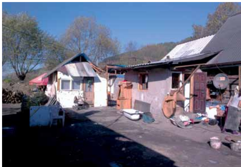
Droga wewnętrzna i budynki mieszkalne na terenie osiedla w Maszkowicach