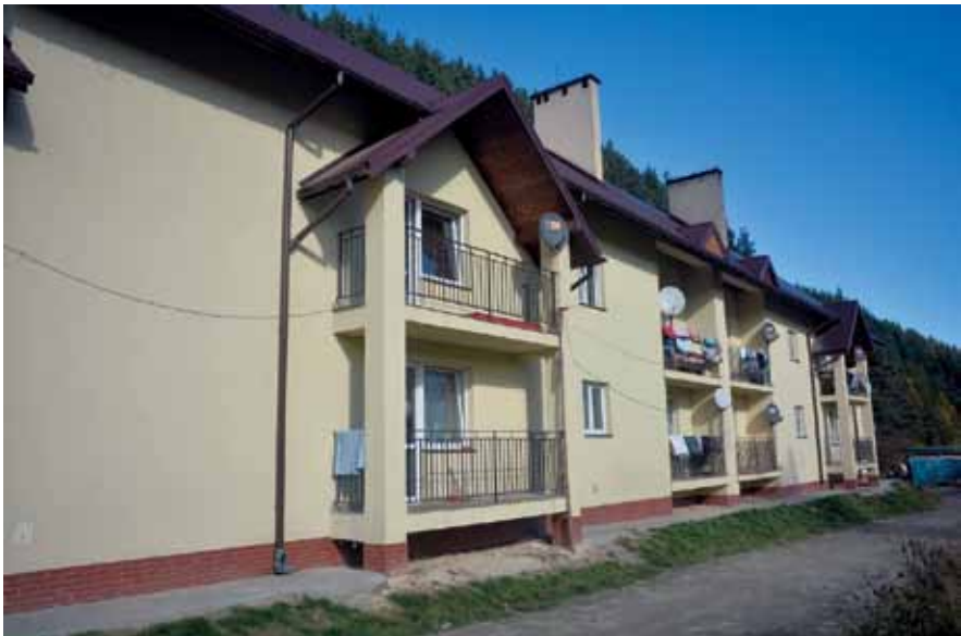
Ochotnica Górna: powyżej – oddany do użytku w 2007 r. blok mieszkalny

W latach 2011–2013 Gmina Ochotnica Dolna otrzymała z programu na rzecz społeczności romskiej w Polsce 695 000 zł. (przy wnioskach opiewających na ponad 1 500 000 zł.). Pozyskane środki przeznaczono na budowę wspomnianego wyżej domu wielorodzinnego oraz wykonanie kładki pieszo – jezdnej, łączącej osiedle z drogą publiczną.