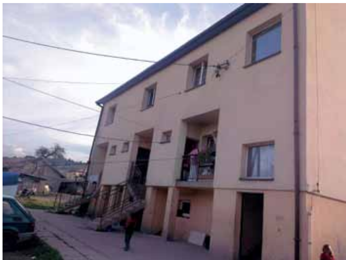
Blok w Koszarach k. Limanowej, fot. K. Łakoma

Odrębną kwestią są natomiast interwencje Policji w związku ze zgłoszeniami dotyczącymi spalania nieczystości na terenie osiedla. Tym niemniej, z 13 przeprowadzonych w latach 2012–2013 interwencji, jedynie w dwóch przypadkach potwierdzono spalanie odpadów przemysłowych (w pierwszym przypadku sprawca został ukarany mandatem, w drugim pouczone).