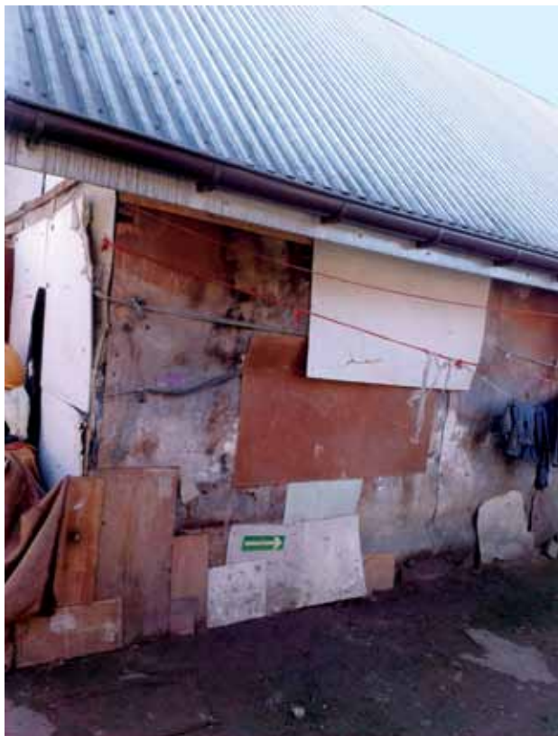
Charakterystyczny dla Maszkowic widok: nowy dach na starym budynku, fot. K. Łakoma

W jednym z budynków działa świetlica przeznaczona dla zamieszkujących w osadzie dzieci. Warto przy tym zaznaczyć, że świetlica wybudowana została na gruncie należącym do Gminy, który wydzierżawiony został Romom za symboliczną opłatą. Podobnie, jak w przypadku Koszar – Limanowej, jest to obiekt o stosunkowo wysokim standardzie. Odpowiednio wyposażona sala lekcyjna w świetlicy zapewnia dzieciom godne warunki do nauki. Placówka sfinansowana została ze środków pochodzących z Programu na rzecz społeczności romskiej. Podobnie, jak w Koszarach, w planach jest utworzenie przy świetlicy punktu przedszkolnego. Realizacja tych planów zależy rzecz jasna od pozyskania odpowiednich środków finansowych.