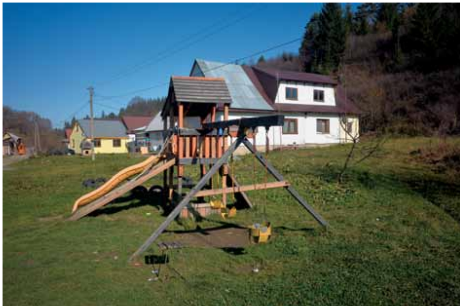
Plac zabaw na osiedlu w Zadziale

Warto przy tym zwrócić uwagę na dobre relacje pomiędzy Romami a władzami szkoły podstawowej i pozostałymi rodzicami. Przy szkole działa zespół romski, regularnie organizowane są dni kultury romskiej, dzieci biorą udział w wycieczkach szkolnych, w których, w charakterze opiekunów, uczestniczą także dorośli z osiedla.