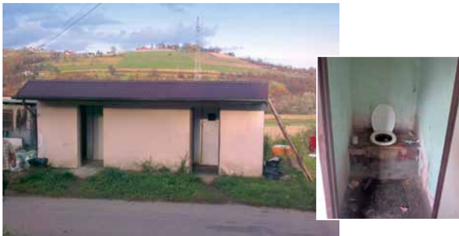
Ogólnodostępna toaleta na terenie osiedla w Koszarach k. Limanowej i jej wnętrze

Problemem pozostaje także wywóz śmieci. Jak wynika z uzyskanych od mieszkańców informacji, śmieci odbierane są raz w miesiącu. Na terenie osiedla nie ma zaś miejsca, które przystosowane byłoby do przechowywania odpadów do czasu ich wywozu. Odpady, popakowane w worki, składowane są zatem bezpośrednio na ziemi lub w prowizorycznych, zdewastowanych kontenerach. Raz w miesiącu mieszkańcy przenoszą je w wyznaczone miejsce, przyjeżdżając na teren osiedla, skąd są odbierane.