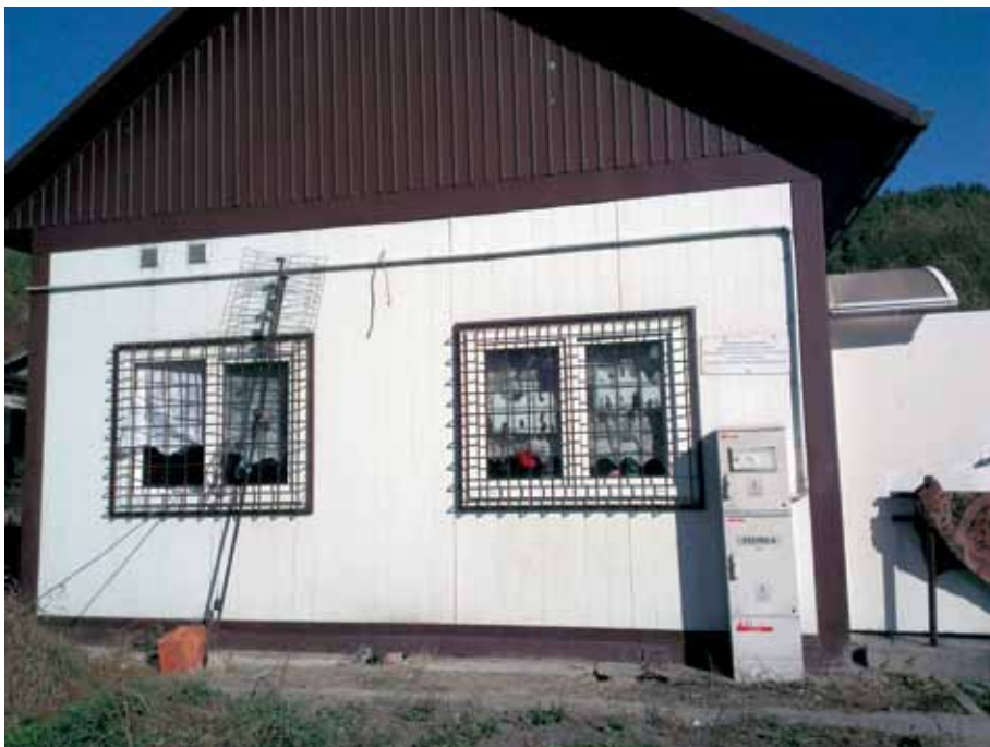
Świetlica na osiedlu w Maszkowicach, fot. K. Łakoma