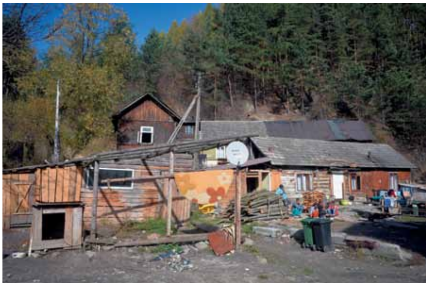
Ochothnica Górna: nadal istniejące samowole budowlane, fot. M. Sośniak

Osiedle ma dostęp do sieci wodociągowej i kanalizacyjnej. Doprowadzono także instalację elektryczną. Budynek ogrzewane są za pomocą węgla lub drewna (w bloku wielorodzinnym działa kotłownia, obsługiwana przez jednego z mieszkańców).