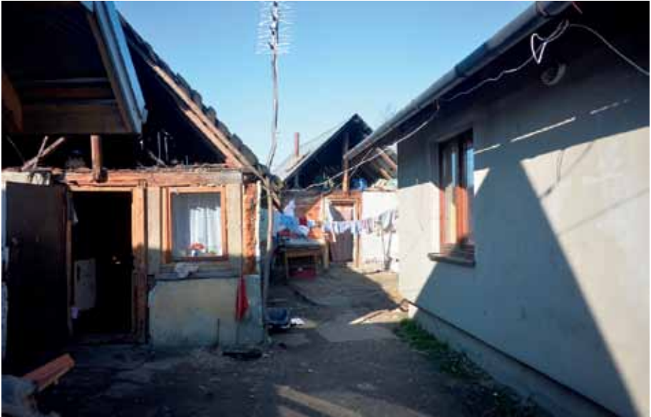
Kolejny przykład budownictwa z Maszkowic: jeden z nielicznych wyremontowanych budynków (z prawej)

Zdaniem Romów, środki wydawane na remonty należałoby przeznaczyć na nowe zagospodarowanie terenu całego osiedla, wybudowanie nowych domów i wyburzenie istniejących. Na takie rozwiązanie Gmina się jednak nie godzi. W skierowanym do Rzecznika piśmie Wójt Gminy przedstawił natomiast inną propozycję, sprowadzającą się do wykupu dla Romów z Maszkowic mieszkań, ale poza terenem Gminy Łącko.