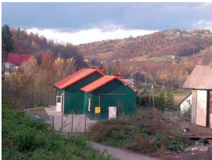
Świetlica osiedlowa w Koszarach k. Limanowej

W czerwcu br. do użytku oddano nowy budynek, w którym mieści się świetlica przeznaczona głównie, choć nie tylko, dla zamieszkujących w osadzie dzieci. Wykonawcą obiektu był miejscowy Caritas, a środki na budowę pochodziły z Programu na rzecz społeczności romskiej. W porównaniu z pozostałą zabudową, jest to obiekt o wysokim standardzie. W budynku znajduje się odpowiednio wyposażona sala lekcyjna, osobny węzeł sanitarny oraz kuchnia. Świetlica służy mieszkańcom osiedla jako miejsce spotkań, działa w niej niewielka sala komputerowa i prowadzone są zajęcia edukacyjne dla dzieci.