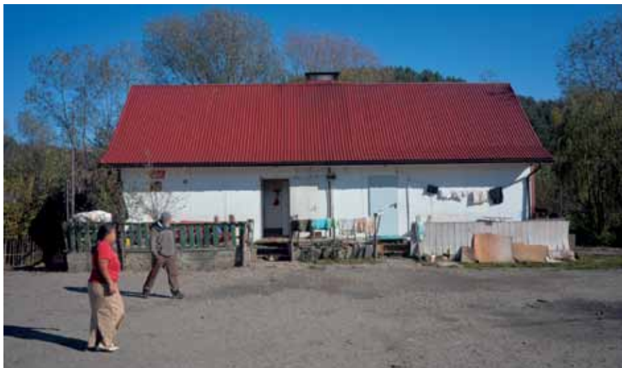
Maszkowice: jeden z czterech dwurodzinnych kontenerów mieszkalnych

Od czasu postawienia kontenerów Gmina nie wybudowała żadnych nowych domów. Wójt Gminy Łącko tłumaczył to brakiem możliwości rozbudowy osiedla, wynikającym z faktu, że znajduje się ono na terenie zalewowym. Z pozyskiwanych przez Gminę środków, pochodzących z Programu na rzecz społeczności romskiej, wykonywane są natomiast remonty istniejących budynków, w tym także tych postawionych nielegalnie. I tak, w latach 2011–2013 Gmina przeprowadziła na terenie osiedla inwestycje o łącznej wartości ponad 270 000 zł (taką też kwotę otrzymała z ww. Programu). W ramach prac remontowych ocieplane były elewacje, wymieniano dachy i instalacje wewnętrzne, a także dobudowywano dodatkowe pomieszczenia sanitarne.