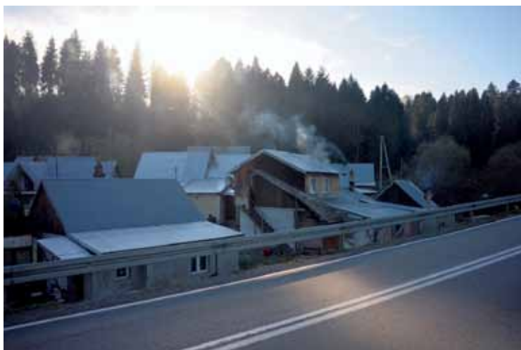
Krośnica: widok z drogi

Do osiedla doprowadzono instalację wodociągową. Mieszkańcy twierdzą jednak, że nie każdy dom został do tej podłączony. Brak dostępu do wodociągu był przy tym jednym z głównych problemów zgłaszanych przez mieszkańców. Co innego wynika jednak z wyjaśnień udzielonych Rzecznikowi Praw Obywatelskich przez Wójta Gminy Krościenko. Wójt zapewnił bowiem, że do sieci wodociągowej, wybudowanej w 2011 r., podłączone zostały wszystkie budynki.