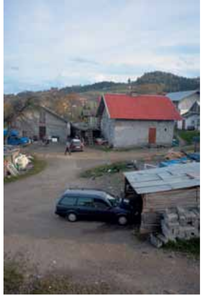
Widok osiedla w Koszarach k. Limanowej

Wójt Gminy Limanowa, poproszony przez Rzecznika o odniesienie się do sprawy meldunków, wyjaśnił, iż nie stanowi to problemu. Jego zdaniem, w ciągu kilku ostatnich lat nie miał miejsca żaden przypadek odmowy zameldowania na pobyt stały i czasowy członka społeczności romskiej, a wszystkie składane wnioski o zameldowanie były wnikliwie rozpatrywane.