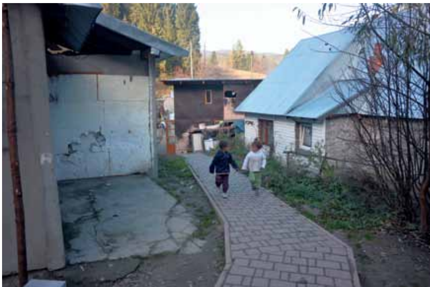
Krośnica: fragment brukowanego chodnika na osiedlu