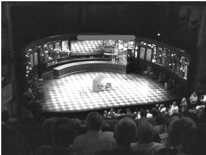
Pasek oznacza miejsce, gdzie są wyświetlane napisy u góry lub na dole

Ogółem wystawiono w polskich teatrach ok. 70 spektakli teatralnych z napisami dla głuchych. Większość przedstawień (ponad 50) została zorganizowana z inicjatywy organizacji pozarządowych (projekt Teatr „Poza Ciszą i Ciemnością”, prowadzony przez Fundację „Kultura bez Barrier” i Fundację Dzieciom „Zdążyć z Pomocą”). Daje to liczbę około 20 spektakli teatralnych rocznie, gdzie tytuły się często powtarzają, czyli w dalszym ciągu to bardzo uboga oferta kulturalna dla głuchych Polaków. Spektakle te były wystawiane głównie w Warszawie oraz sporadycznie w Krakowie, Poznaniu i Katowicach.