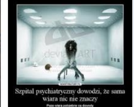
Szpital psychiatryczny dowodzi, że sama wiara nie nie znaczy Płacz wstąpił porażenie się dźwięki