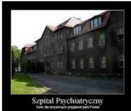
Szpital Psychiatryczny Darem dla zmierzających przyleciał panu P. podał