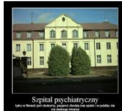
Szpital psychiatryczny Tylko w ten sposób jest odskoczniem postrzeżeń (niezgodnie) w praktyce nie nie jest łatwym lekarstwem