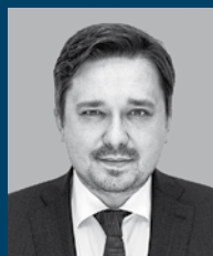
Marcin Wiącek od 2021