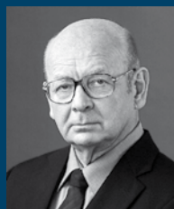
Janusz Kochanowski 2006–2010