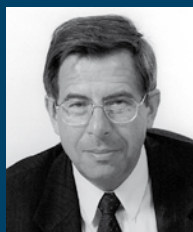
Andrzej Zoll 2000–2006