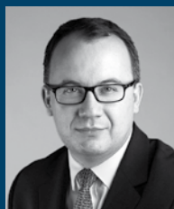
Adam Bodnar 2015–2021