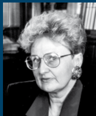
Ewa Łętowska 1987–1992